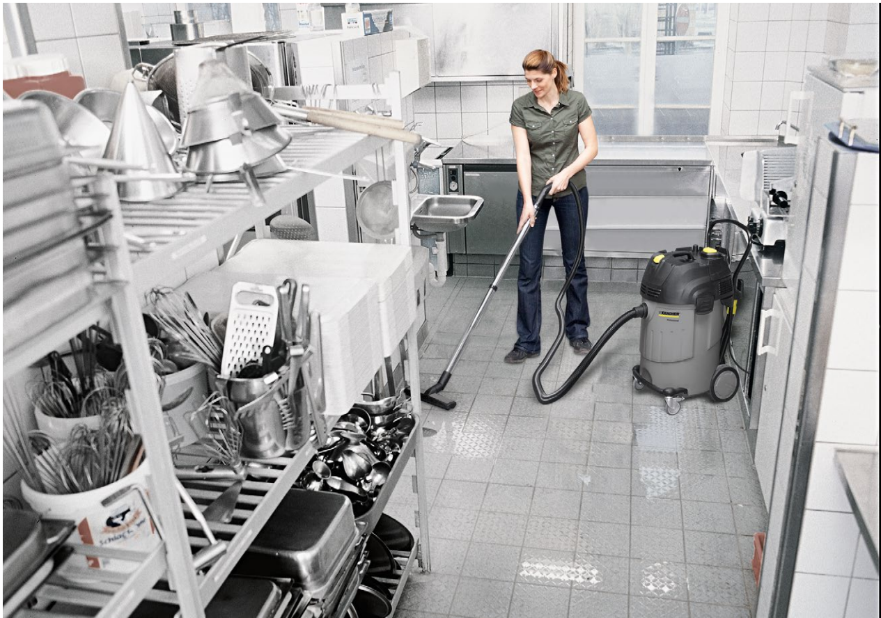
NT 65/2 Ap