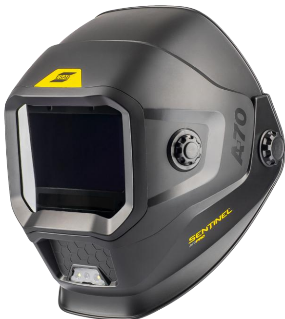
Sentinel A70 Pro