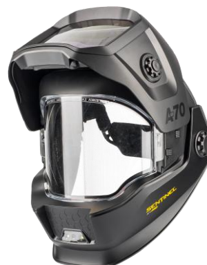
Sentinel A70 Pro