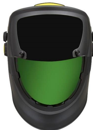
Stort inre visir för slipning