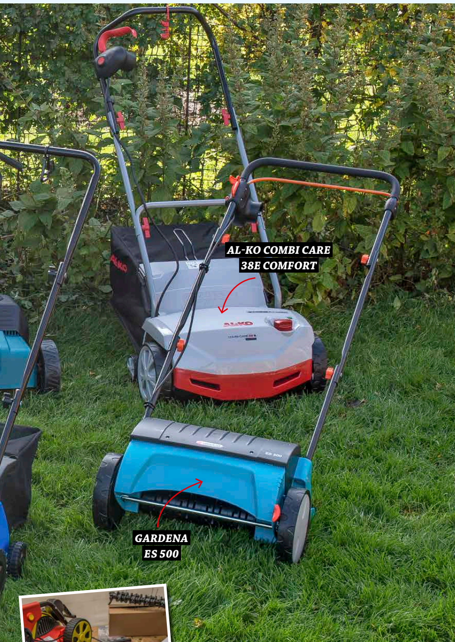
AL-KO COMBI CARE 38E COMFORT