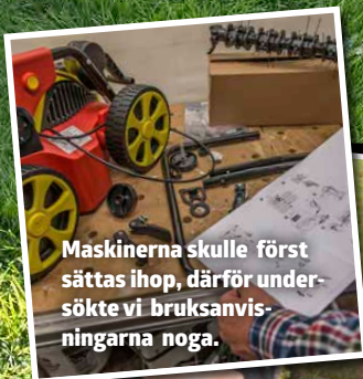
GARDENA ES 500

Maskinerna skulle först sättas ihop, därför undersökte vi bruksanvisningarna noga.