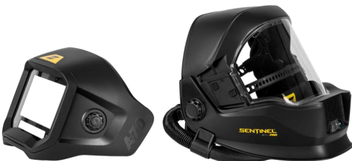
Sentinel A70 Air PRO avtagbar ADF