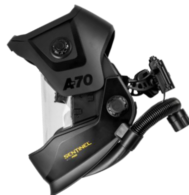
Sentinel A70 Air PRO