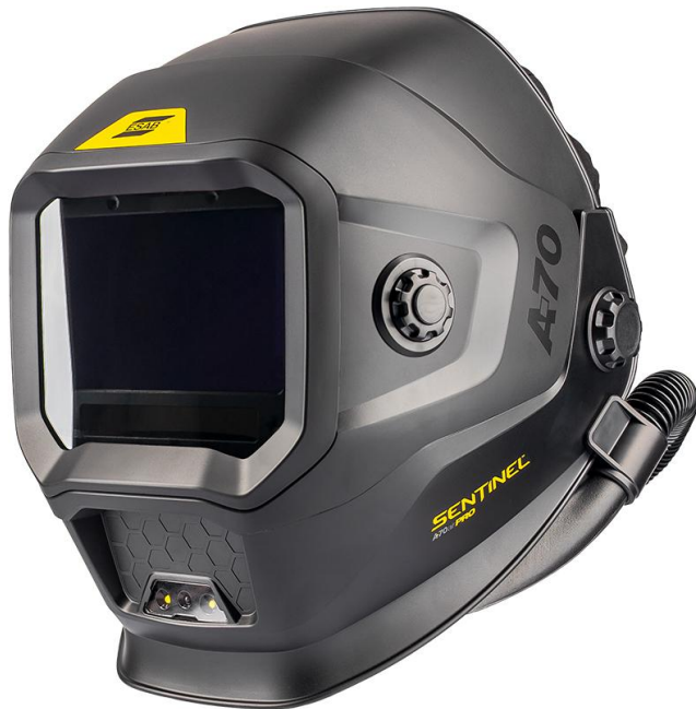
Sentinel A70 Air PRO